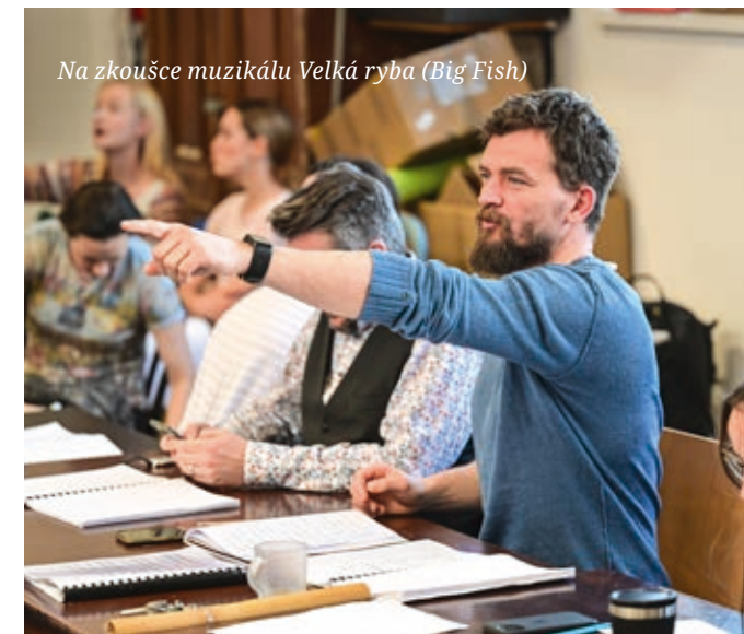
Na zkoušce muzikálu Velká ryba ( Big Fish )