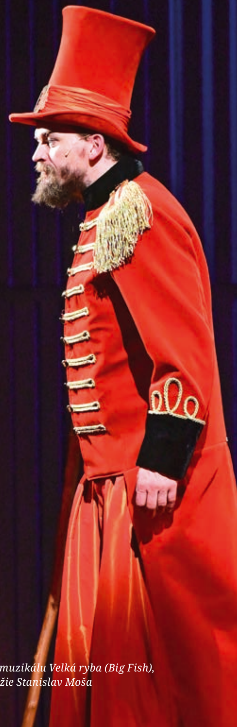
V muzikálu Velká ryba ( Big Fish ), režie Stanislav Moša