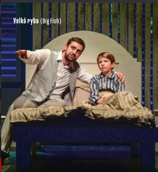
Velká ryba (Big Fish)